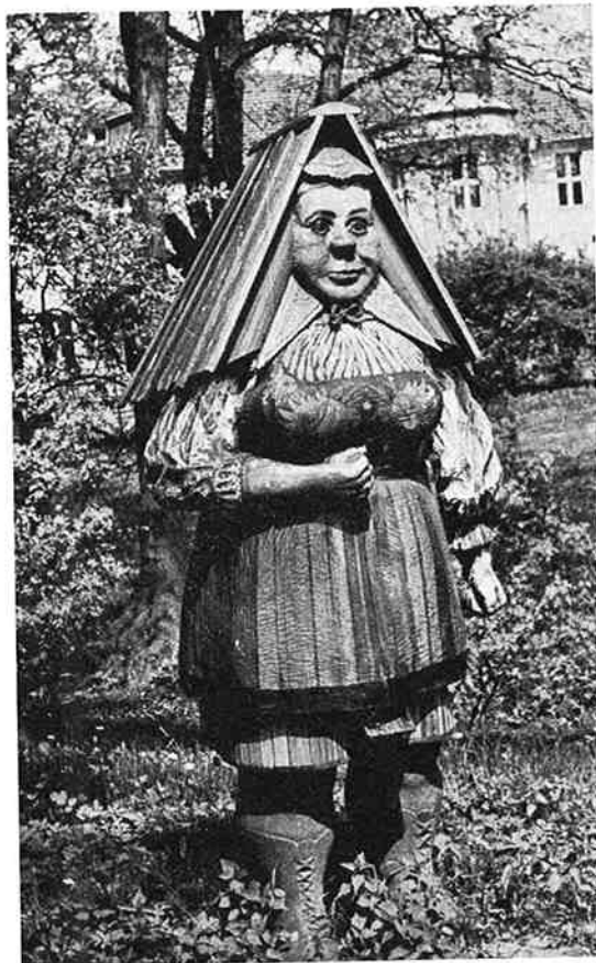
„Klotzbeute" in de vorm van een boerin aanwezig in een bijenmuseum in Polen.

Wie anders dan de patroon der imkers zou voor het welzijn van de bijenvolken kunnen zorgen? Vooral in de rooms-katholieke streken van Zuid-Nederland leefde het geloof in de uitstralende kracht van deze heilige meer dan elders. Er waren daar in vroeger tijd (nu nog enkele) imkersgilden onder het patronaatschap van St. Ambrosius. De heer L. van Giersbergen, die in 1905 door de vereniging aangesteld werd als wandelleraar en van 1919 tot 1935 de eerste Rijksbijenteeltconsulent was, schreef in „Beschouwingen betreffende de Bijenteelt in de Provincie Noordbrabant" (Tilburg, 1927) het volgende: „Die veel liefhebberij in de bijen hadden maakten een bisschopskorf, ter eere van den heiligen bisschop St. Ambrosius. Dat was een korf van ca. 1 meter hoogte, met hoofd, hals, romp. In het hoofd oogen en een mond, die als vliegkat diende. Hij kreeg ook armen van gips of hout en kwam midden in den stal te staan. Uit Diessen ontvingen wij bericht, dat daar een houten Ambrosiusbeeld in den kloostertuin gestaan heeft tot 1922; in dit jaar is van het beeld kachelhout gemaakt; uit Hooge Mierde vernamen wij, dat enkele jaren geleden met de overige beelden uit de oude kerk ook het